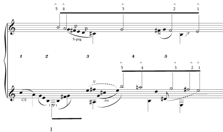
Fig.4 Gráfico da Análise Schenkeriana dos compassos 1 ao 5.

Neste plano frontal dos 5 primeiros compassos da música, percebemos que a linha fundamental da voz é reapresentada pelo violão e se encontram concluindo simultaneamente na nota de tônica da cadência autêntica. Nesta primeira frase da música, já percebemos o estreitamento da relação entre a linha da voz e do instrumento. Nota-se, por exemplo, que a progressão linear da voz interna do violão dá suporte e movimento ao trecho conduzindo-o para a linha fundamental. Ainda que Nicholas Cook (1950) tenha se referido à análise Schenkeriana como uma metáfora, na qual a composição é uma ornamentação em grande escala de uma progressão harmônica básica (1987), a aplicabilidade das conclusões dessa dita metáfora se concretizam quando orientam a execução em direção à coerência da obra.