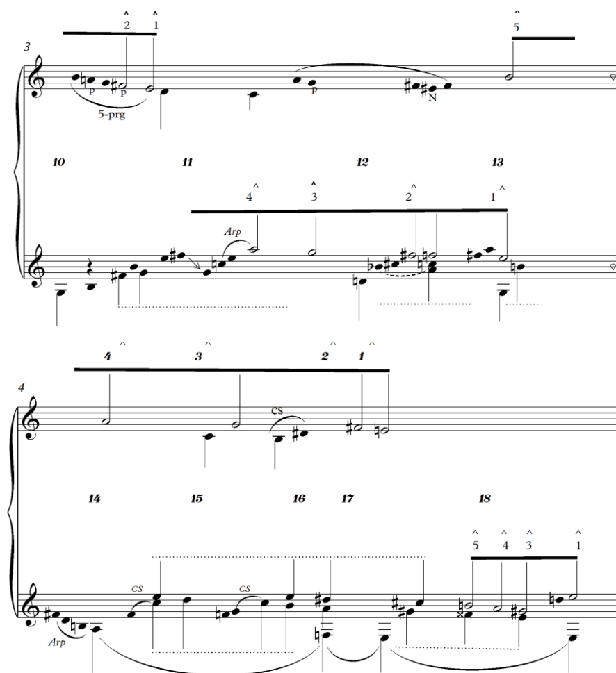
Fig.5 Gráfico da Análise Schenkeriana dos compassos 6 ao 18.

Percebe-se também que, apesar do gráfico representar o plano frontal, a linha da voz se assemelha ao plano de fundo, pois neste trecho da peça, a linha melódica é pouco ornamentada. O gráfico coloca em evidência a, já referida, rarefação da textura a medida que o texto descreve a epifania da pessoa a quem o eu-lírico se dirige. Bem como deixa claro que, cada vez mais o violão suporta a linha melódica, ficando também cada vez menos ornamentado. Ao final da peça, percebemos que, através de um cromatismo descendente em direção a dominante e sua resolução, a linha fundamental da voz se apoia na linha fundamental do violão. Pela primeira vez elas coincidem temporalmente e, conseqüentemente, trazem clareza para a relação que há entre elas. O fato da urlinie feita pelo violão estar incompleta (uma progressão de quinta que termina na terça) pode, inclusive, sugerir que a complementariedade entre voz e violão supre essa incompletude.