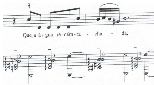
Fig.3 Compassos 20 ao 21.

Uma única figura musical para as sílabas gramaticais cuja escansão demonstrou estarem unidas e a sílaba tônica colocada no tempo forte do compasso, e com mais movimentação melódica do que o trecho que a antecede.