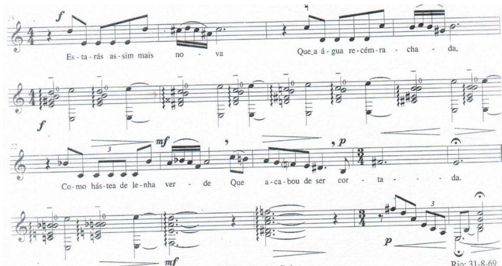
Fig.2 Compassos 18 ao 26.

Esta música utiliza-se de um texto do poeta amazonense Elson Farias (1936). Trata-se de um poema com três quadras heptassílabas e sem rima. O texto trata de um momento epifânico desencadeado pelo remover as cinzas do olhar da pessoa a quem o eu-lírico se dirige. Há, nesta revelação, um aspecto também doloroso, pois o “sabor de puro ver”, inflama a chama de uma dor interior e tudo torna-se novo como lenha verde recém cortada, conforme poderemos ver no poema: