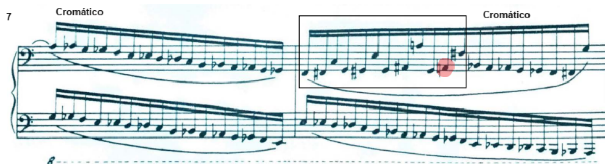
Figura 3 - Transposição do compasso 1 com nota acrescentada, compasso 8 de Ilha de Coral