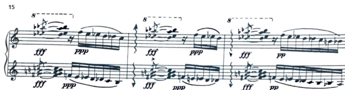
Figura 6 - Bloco sonoro referencial e motivo cromático na subseção c , compassos 15 a 17 de Ilha de Coral