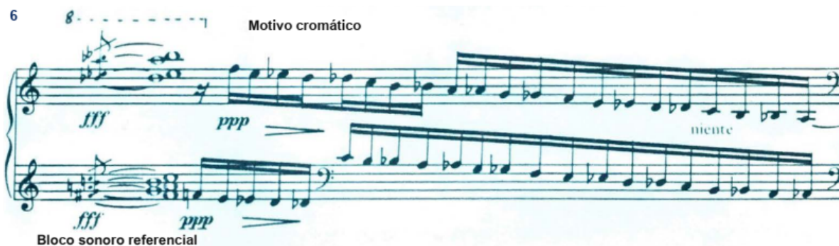
Figura 5 - Subseção b , primeira aparição do bloco sonoro referencial, compasso 6 de Ilha de Coral