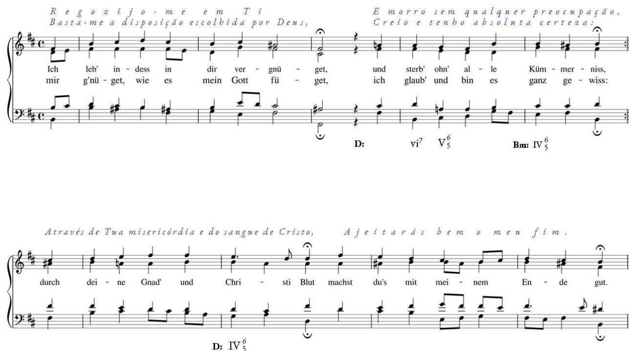
Fig. 1b – Coral BWV 84/5, Ich leb indes in dir vergnügt (Enquanto isso, vivo contente em ti).