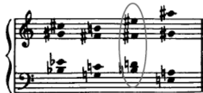
Figura 1 - Tema de Acordes com o fragmento selecionado utilizado, baseado principalmente em terças e sétima maior na região aguda.